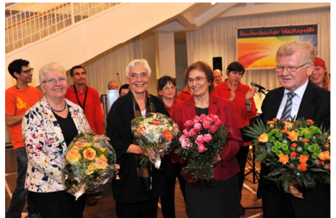
vlnr.: Jury und Stiftungsvorstand